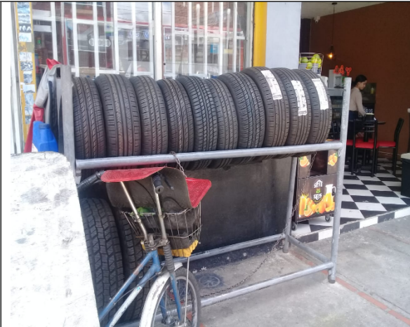
Foto 2. Vista general del acopio de llantas