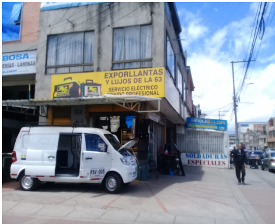
Foto 1. Vista general del establecimiento